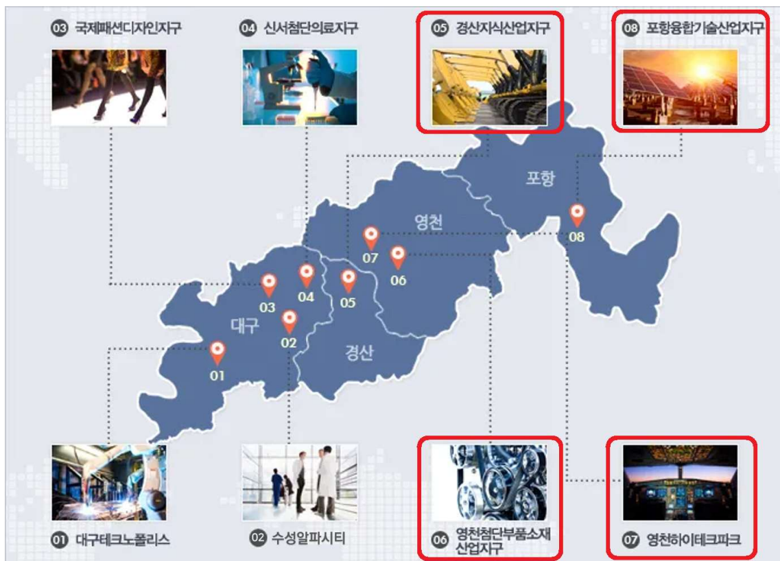
<경제자유구역(경북지구) 4개 지구 위치도>